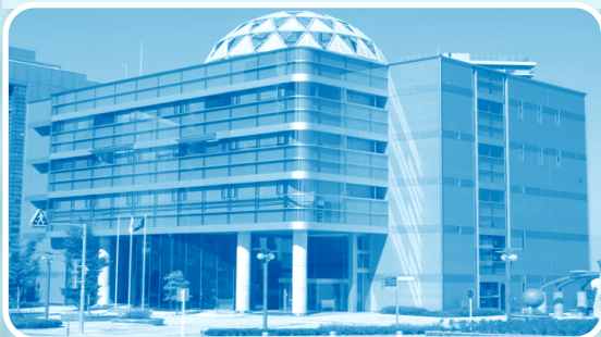
浜松市地域情報センター (中区中央1丁目、裁判所南側)